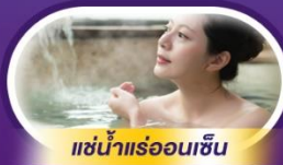
แช่น้ำร้อนเซน