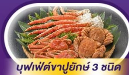
บุฟเฟ่ต์ซาปูยักซ์ 3 ชนิด